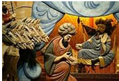
צלאח אל-דין מחוץ לחומות ירושלים