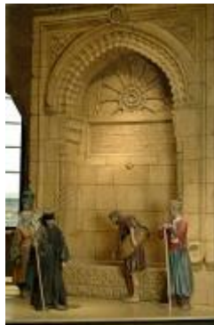
דמויות מייצגות בירושלים במאה ה-19

- התקופה העותמנית סקירת 400 שנות השלטון העות'מאני בירושלים (1517-1917), שבהן ידעה העיר ימים של פריחה ושל שפל. בהם ימי שלטונו של הסולטאן סולימאן המפואר, עת נבנו חומותיה ומרבית שעריה של העיר. במרבית התקופת העותמנית הייתה ירושלים כפר נידח בפאתי האימפריה העות'מאנית אך מצב זה השתנה במאה ה-19, כשחדרו המעצמות האירופיות לירושלים בעקבותיהן נכנסה העיר אל העידן המודרני.