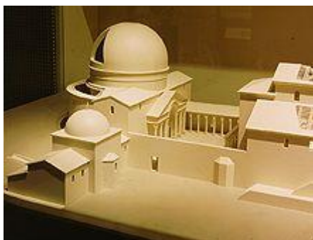
דגם כנסיית הקבר

- התקופה הביזנטית - תצוגה ובה ניתן ללמוד על השינוי שחל במעמדה של העיר ירושלים עם הפיכת הנצרות לדת הרשמית של האימפריה הרומית (המאה ה-4 לספירה). בעקבות כך משכה אליה העיר צליינים מקרוב ומרחוק. בתצוגה משולב דגם של כנסיית הקבר, ייחודי מסוגו בעולם, המציג מראה מלא ומפורט של הכנסייה במאה ה-4 לספירה.