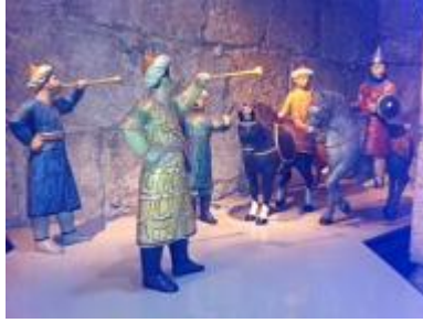
ממלכים ברחובות ירושלים

- התקופה העותמנית סקירת 400 שנות השלטון העות'מאני בירושלים (1517-1917), שבהן ידעה העיר ימים של פריחה ושל שפל. בהם ימי שלטונו של הסולטאן סולימאן המפואר, עת נבנו חומותיה ומרבית שעריה של העיר. במרבית התקופת העותמנית הייתה ירושלים כפר נידח בפאתי האימפריה העות'מאנית אך מצב זה השתנה במאה ה-19, כשחדרו המעצמות האירופיות לירושלים בעקבותיהן נכנסה העיר אל העידן המודרני.