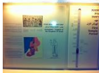
מצור צבא סנחריב על ירושלים