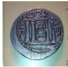
מטבע כסף ועליו הכתובת "ירושלים"

- התקופה הביזנטית - תצוגה ובה ניתן ללמוד על השינוי שחל במעמדה של העיר ירושלים עם הפיכת הנצרות לדת הרשמית של האימפריה הרומית (המאה ה-4 לספירה). בעקבות כך משכה אליה העיר צליינים מקרוב ומרחוק. בתצוגה משולב דגם של כנסיית הקבר, ייחודי מסוגו בעולם, המציג מראה מלא ומפורט של הכנסייה במאה ה-4 לספירה.