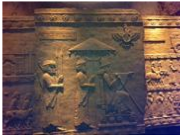
תבליט המציין את הצהרת כורש