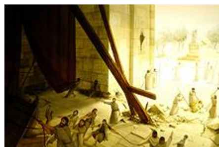
טיהור בית המקדש