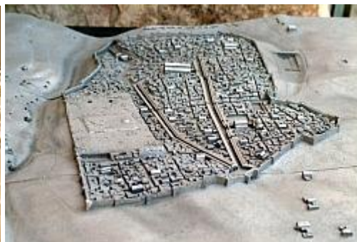
דגם ירושלים הביזנטית

- התקופה המוסלמית התצוגה מספרת את סיפורם של למעלה מארבע מאות שנות כיבוש מוסלמי בירושלים שתחילתו בשנת 638 לספירה כשכנעה ירושלים בפני הכובשים המוסלמיים, והייתה למרכז הדתי השלישי בחשיבותו לאיסלאם. בתצוגה משולב דגם ייחודי המתאר את מבנה כיפת הסלע כפי שנראה סמוך לבנייתו (מאה 7 לספירה).